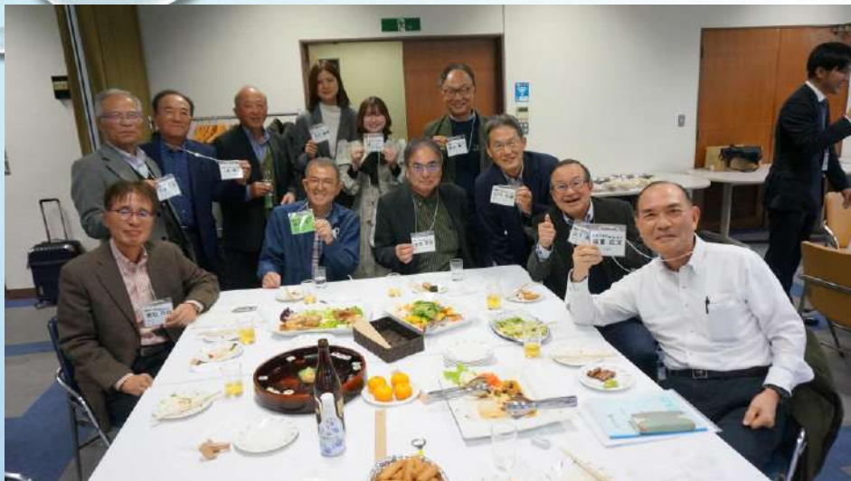
5～11期機械、電気、と新人