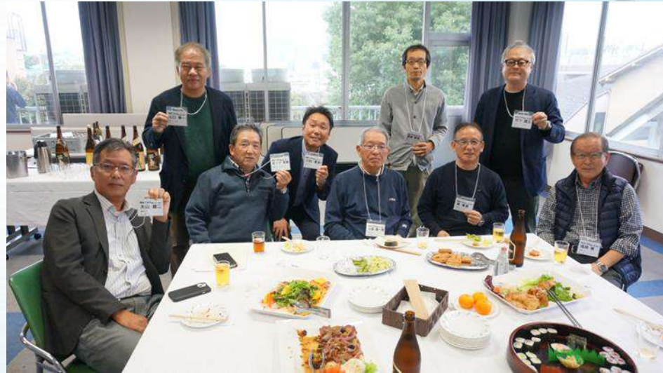
9~28期機械工学の皆さん