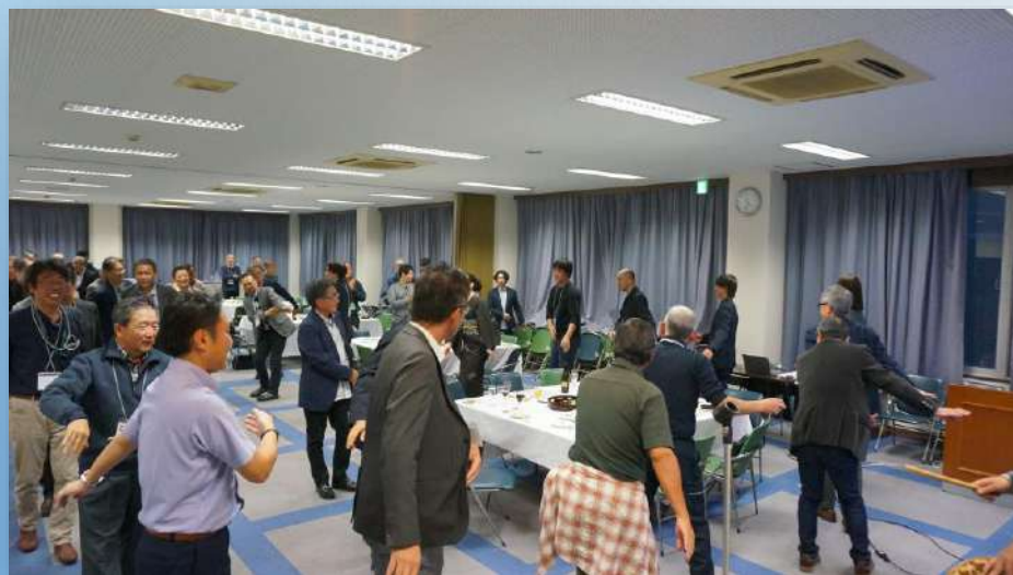
輪になって踊ろう♪