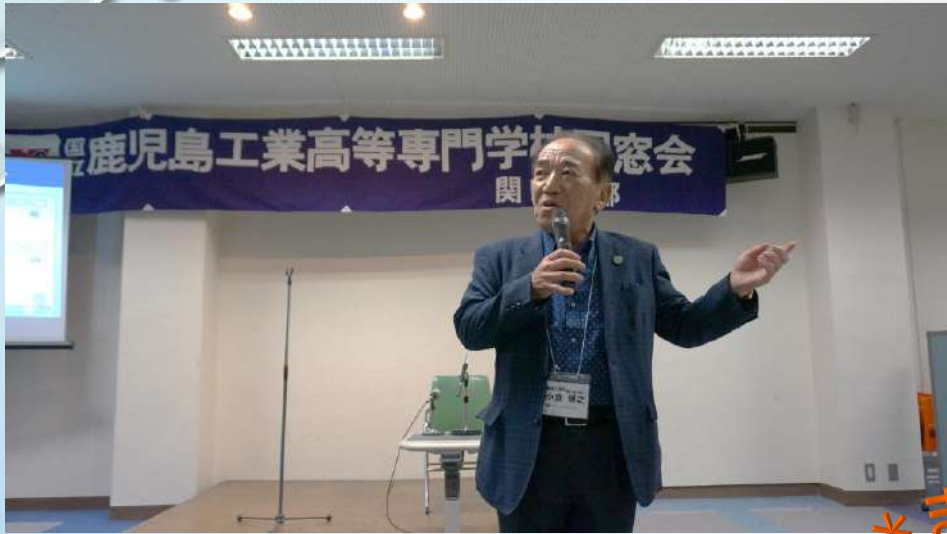
小倉副支部長による締めあいさつ(9M)