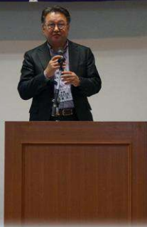
末廣本部長乾杯の音頭