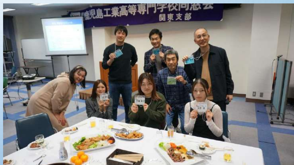
電気、情報、環境工学の皆さん