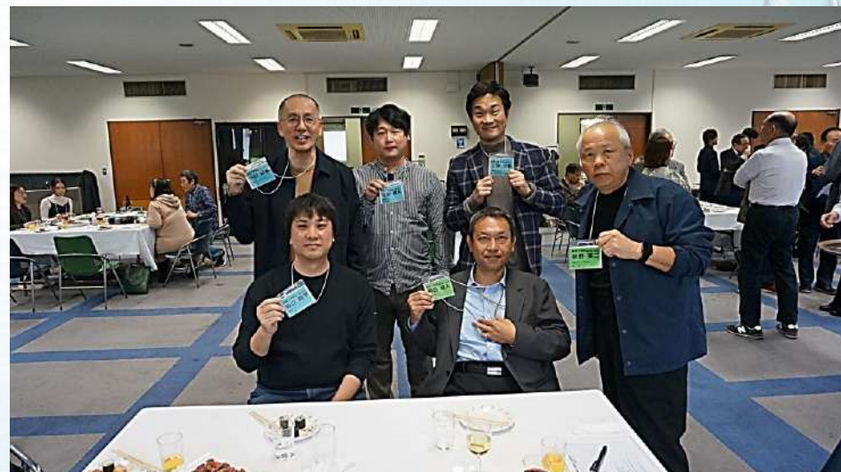
情報工学と電気の皆さん