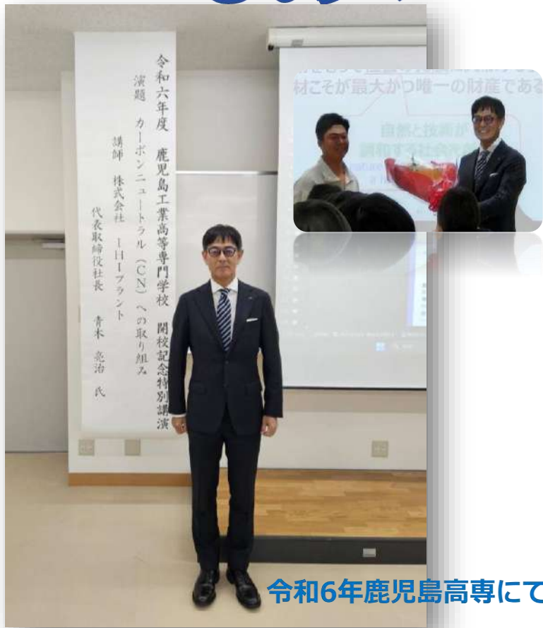
令和6年鹿児島高専にて講演